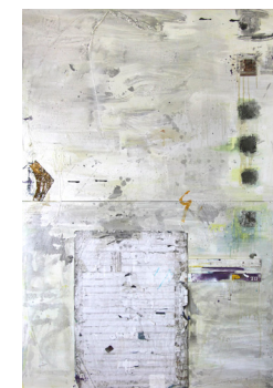
Det Svenske E