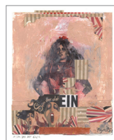
Som var det EIN

Helt konkret har jeg slæbt kilovis af papirstumper hjem fra storbyer som Venedig og Barcelona, men i et par af mine nyeste collager – fx. Unst og Vista Music (fra 2018, begge udstilles her) – indgår rester af jazz-plakater fra den tyske by Sindelfingen, hvor jeg deltog i en kunstmesse i marts i år.